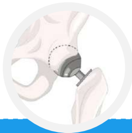
Figura 3. Requisitos específicos de trazabilidad para dispositivos médicos implantables y/o equipos biomédicos.