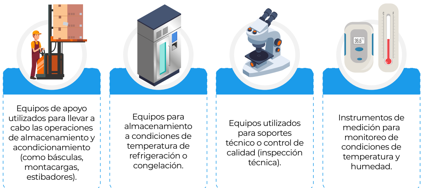
Figura 2. Equipos para el proceso de almacenamiento y acondicionamiento.

De manera general, los equipos e instrumentos de medición corresponden a aquellos utilizados para llevar a cabo alguna de las etapas del proceso de almacenamiento y acondicionamiento, así como los instrumentos de medición (ver figura 2).